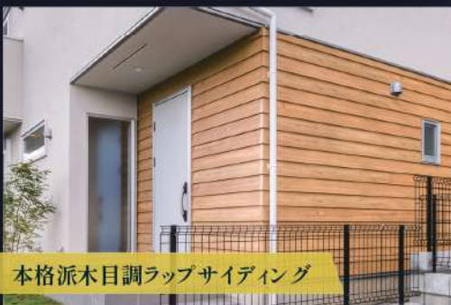
本格派木目調ラップサイディング