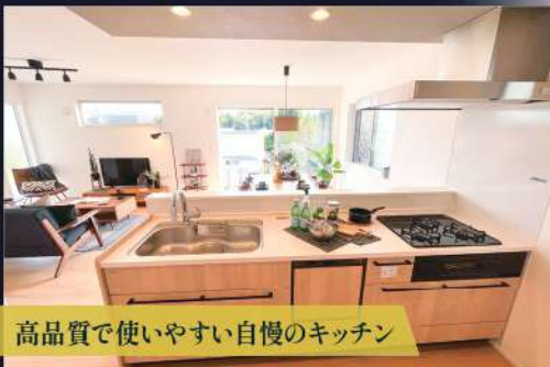
高品質で使いやすい自慢のキッチン