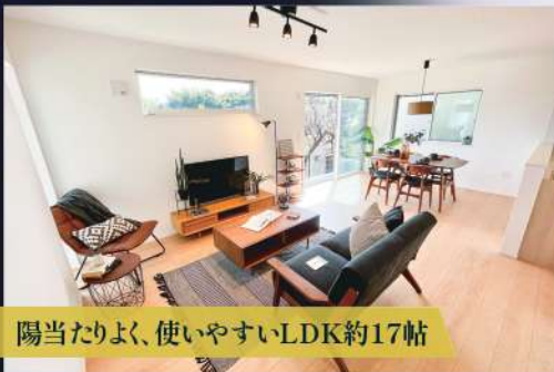
陽当たりよく、使いやすいLDK約17帖