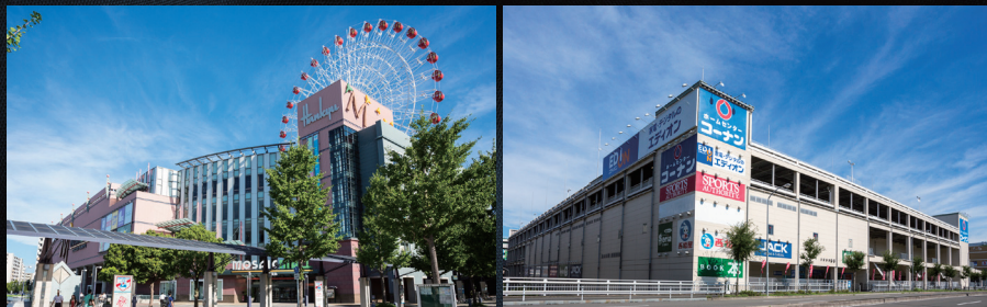
モザイクモール港北