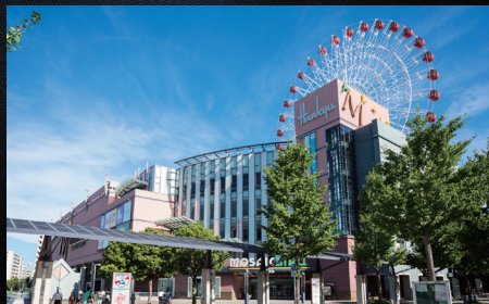
モザイクモール港北